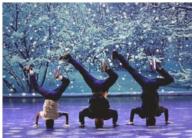
Spectacle de break dance des élèves de Sweet Dance, 2019

C'est également le flou du côté de Calou. "J'ai toujours fait respecter les distances de sécurité et les gestes barrières à mes élèves de théâtre. Cela ne nous a pas empêchés de travailler sur scène, dans une grande salle. C'est l'incompréhension totale", explique t-elle. Même constat pour Ingrid. "En début d'année, tous les gestes barrières ainsi que les distances de sécurité ont été respectés. Nous désinfectons nos équipements et la salle de danse était aérée tout le long des séances. C'est illogique que nous ne puissions pas exercer notre métier alors que les écoles sont ouvertes", déduit-t-elle. Plus que jamais aujourd'hui, préservons les liens et l'entraide !