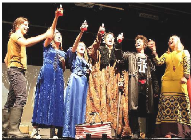
Spectacle du club théâtre, 2019