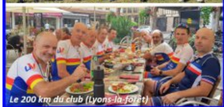
Le 200 km du club (Lyons-la-forêt)

L'UVO ne s'arrête jamais ! Qu'il vente, qu'il pleuve ou qu'il cogne, que ça monte, que ça descende ou que ça glisse (pas trop quand même), que ça mouche, que ça crève (pschiiit) ou que ça covide, on s'auto-teste par tous les temps et sur toutes les routes de France et de Navarre avec notre fidèle bicyclette !