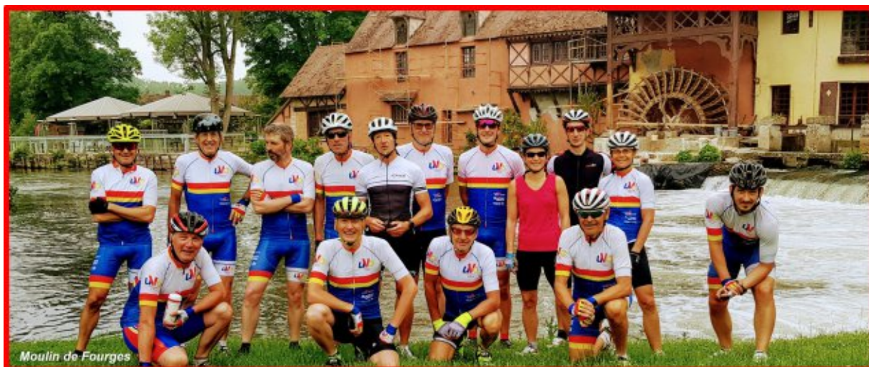
Moulin de Fourges