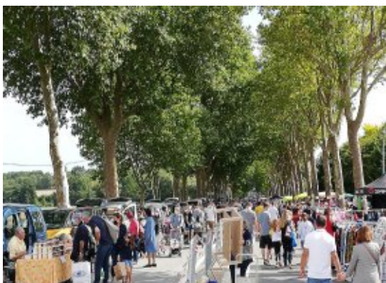
Foire aux greniers du 12 septembre

Retrouvez à tout moment nos dernières actualités sur le site : http://www.planetecoeur.org