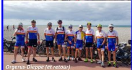
Orgerus-Dieppe (et retour)