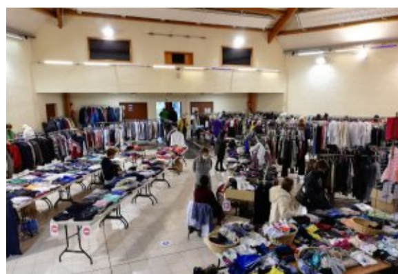
Foire aux vêtements du 31 octobre