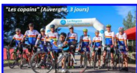
"Les copains" (Auvergne, 3 jours)