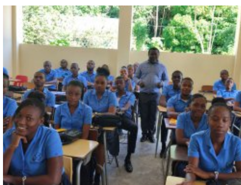
Les cours reprennent petit à petit en Haïti