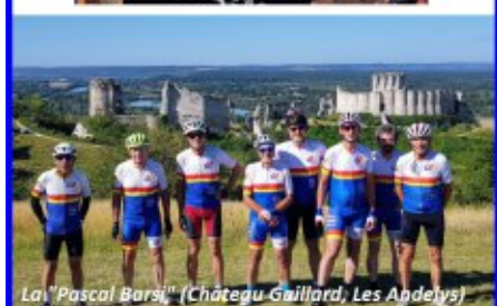
La "Pascal Barsi" (Château Gaillard, Les Andelys)