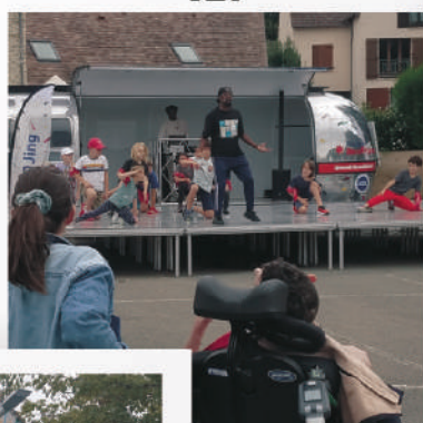
caravane de la Région