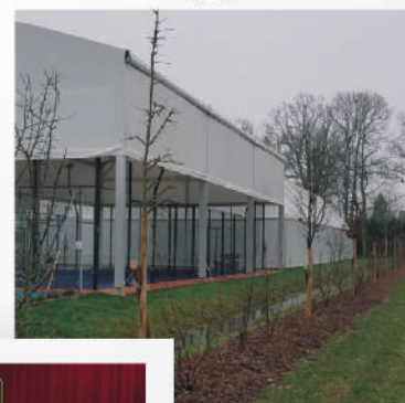
fin des travaux à la butte des moulins