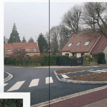
Rénovations de la rue du parc