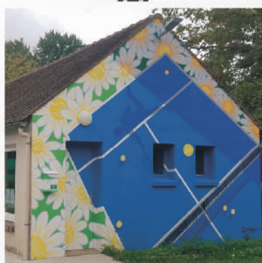
Fresque butte des moulins