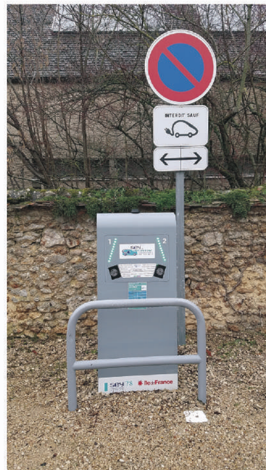
Borne du SEY (Tremblay)

Nous sommes heureux de poursuivre pour vous et avec vous la modernisation et les aménagements nécessaires de notre espace commun pour l'inscrire dans notre temps où l'éco-responsabilité doit devenir concrète aussi vite que possible.