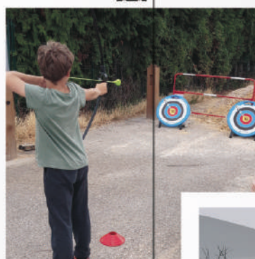
journée sport en plein air